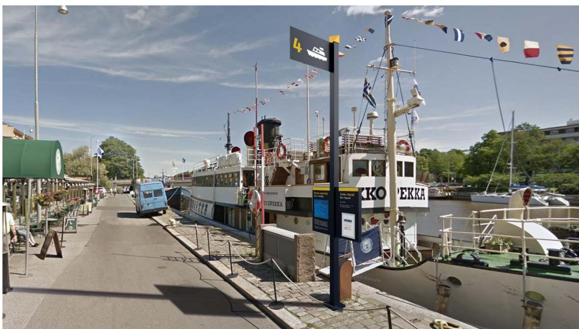
Havainnekuva Saaristosataman opasteista, jotka kertovat mm. laiturin numeron, aikataulun sekä kuljettavan reitin.

Aurajoen alajuoksulla sijaitsevaan Saaristosatamaan panostettiin toteuttamalla uudet opasteet saaristolaivoille, Itäiselle rantakadulle on suunniteltu historiasta kertovia opasteita, joiden toteutus on 2024–2025. Halistenkosken opastamisen suunnitelma on valmis.